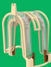
Resistência Luna 4 temperaturas