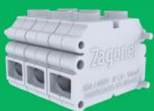
Conector de cabos modular